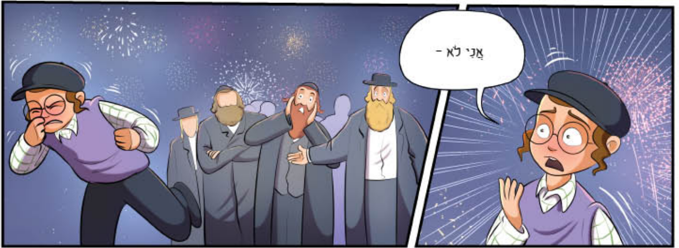
המשך: יבוא בעז"ה

לקבלת העלון להפצה בבית הכנסת חייגו: 02-5379160 שולוחה 0