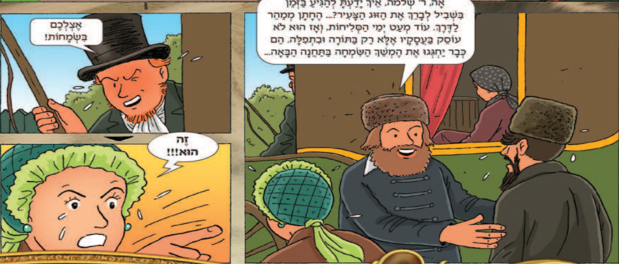
המשיך יבוא בע"ה