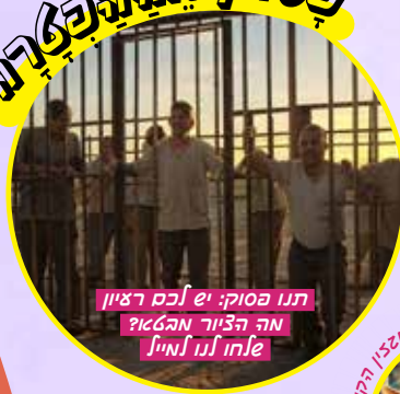
תנו ססוק: יש לכם רעיון מה הציור מהאזן ולחו לנו לחייל